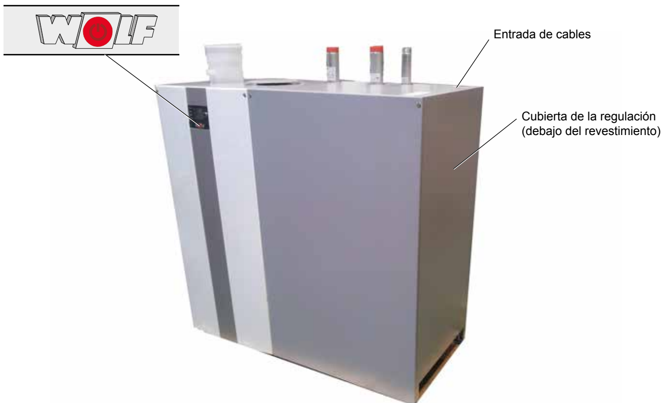
Panel frontal con interruptor principal

En el panel frontal puede integrarse opcionalmente un módulo indicador AM o una unidad de mando BM-2 para operar la caldera. El interruptor principal (integrado en el logotipo Wolf) realiza una desconexión omnipolar del equipo.